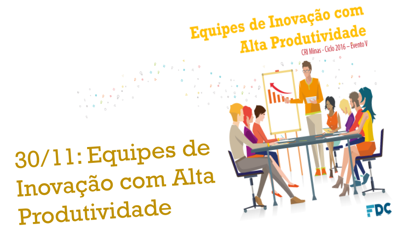
30/11: Equipes de Inovação com Alta Produtividade