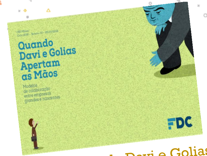
05/10: Quando Davi e Golias Apertam as Mãos: modelos de colaboração entre empresas grandes e nascentes