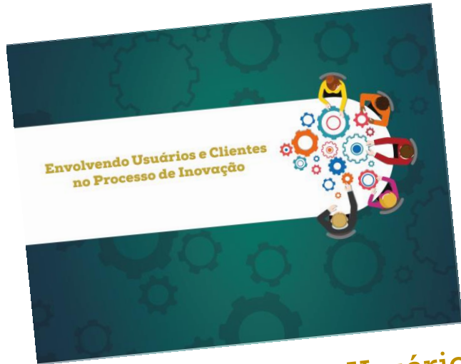
02/03: Envolvendo Usuários e Clientes no Processo de Inovação