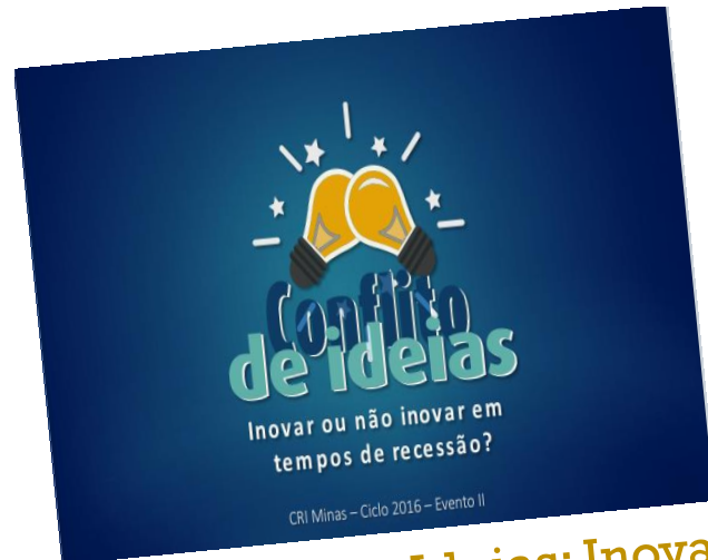
04/05: Conflito de Ideias: Inovar ou não em tempos de recessão?