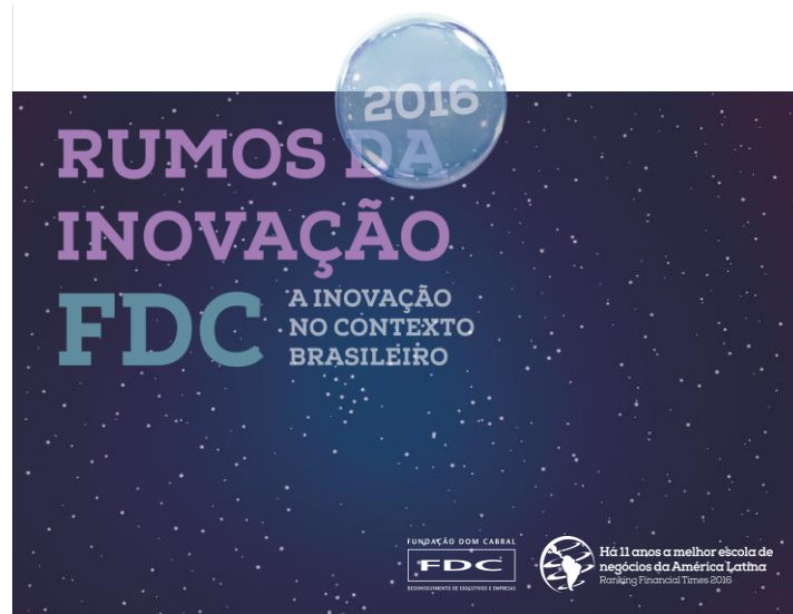
17/08: Rumos da Inovação Digitalização & Ecosystema